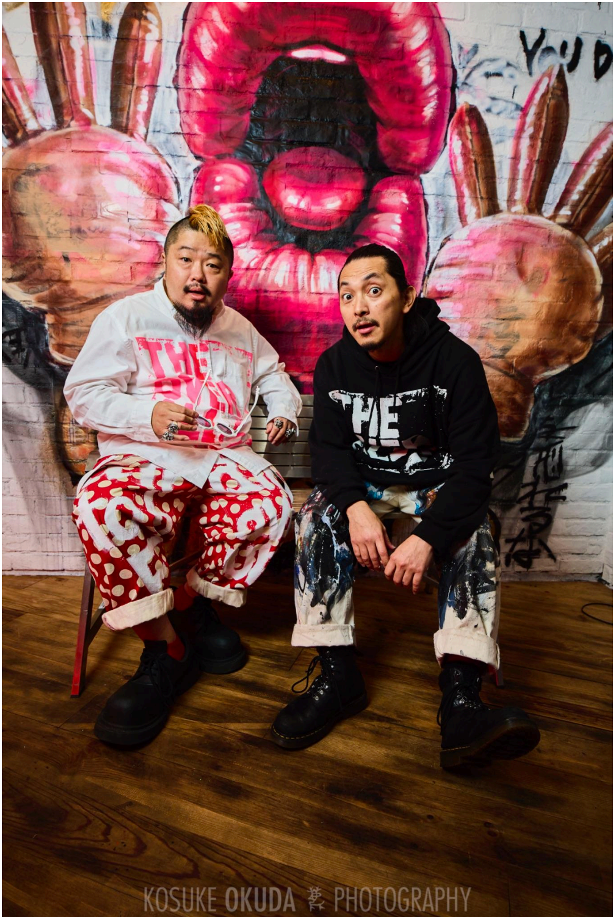
情熱大陸でも紹介された、年間40作品以上を手掛けるミューラル(壁画)アーティスト。